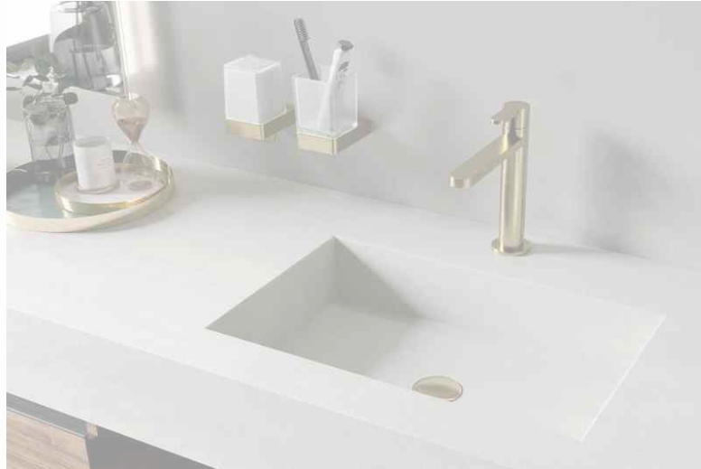
accessori bagno INDA