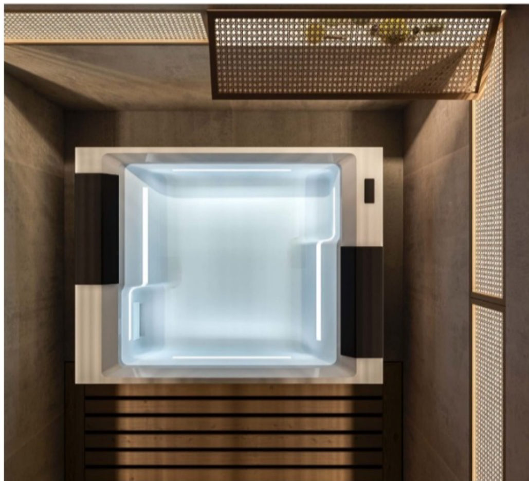
Treesse | Soul 150

Al contatto con l'acqua i pensieri si sciolgono, i muscoli si rilassano: un'esperienza totalizzante da concedersi in splendida solitudine o in dolce compagnia. Soul può accogliere comodamente due persone.